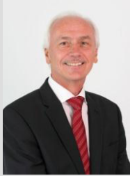
Peter König 1. Bürgermeister